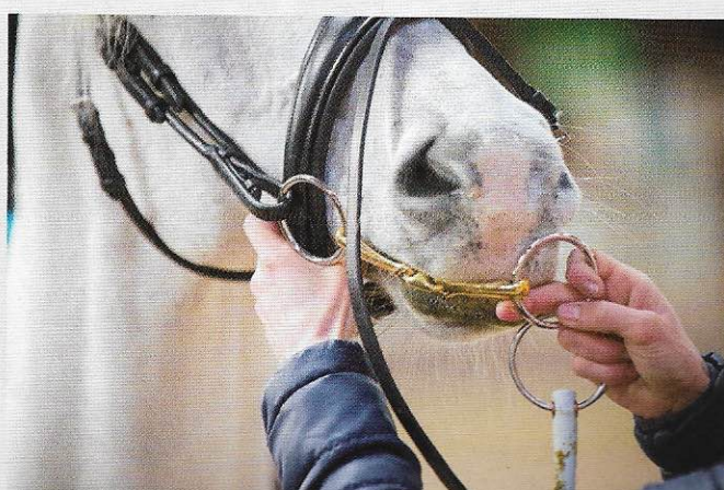
Een bit moet zo worden gehangen dat het hoofdstel makkelijk over de oren kan. Bungelt het bit en kun je het door de mond halen, dan hangt het te laag.